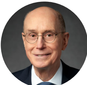
Presidentti Henry B. Eyring toinen neuvonantaja ensimmäisessä presidenttikunnassa