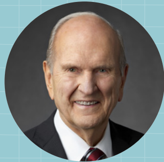
Russell M. Nelson forseti

Aðlagð úr „Hugsjið himneskt!“ aðalráðstefna, okt. 2023.