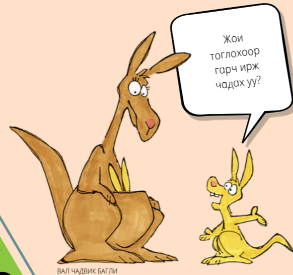
ВАЛ ЧАДВИК БАГЛИ

Бүх хонийг хашаанд багтаахад болго. Та (дараагийн хуудсан дээрх өгүүллийг уншсаны дараа) 29-р хуудсан дээрх эвлүүлдэг зургийн хэсгүүдийг хайчлан авч, тэдгээрийг зохион байгуулж эсвэл оронд нь эдгээрийг зурсан ч болно.