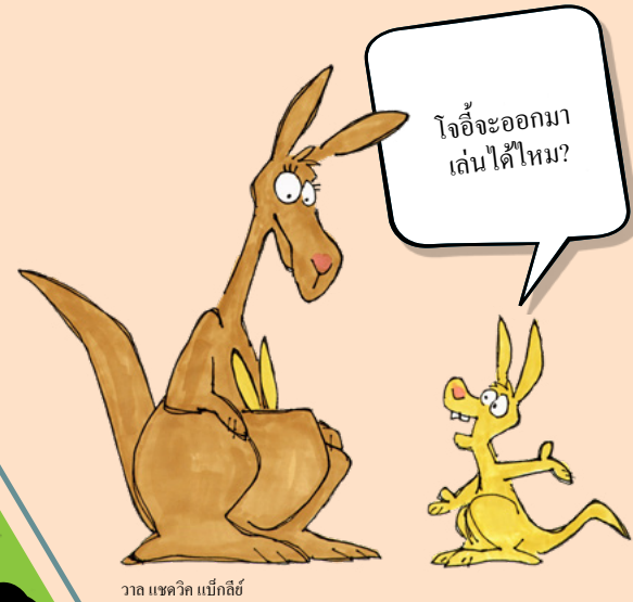
วาล แซดวิก เบ็กทีย์

จัดเรียงให้แกะทุกตัวอยู่ในคอกอย่างพอดี ท่านทำได้โดยตัดแผ่นภาพปริศนาในหน้า 29 (หลังจากท่านอ่านบทความในหน้า ถัดไปแล้ว) และจัดเรียงแกะ หรือ วาดภาพแกะแทนก็ได้