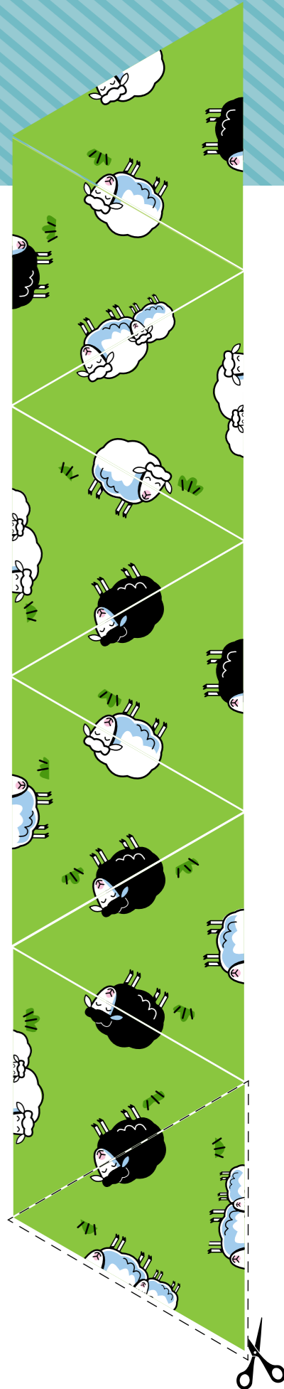
HÌNH ẢNH MINH HOA DO DAVID KLUG THỰC HIỆN

Trong An Ma 32, lời của Thượng Đế được so sánh với một hạt giống “được trồng trong tim [mọi người].” Em có thể “trồng” mỗi loại hạt trong số chín hạt giống khác nhau bằng cách điền vào ô lưới không? Em chỉ được có một (và chỉ một!) hạt của mỗi loại trong mỗi hàng, cột, và ô màu.