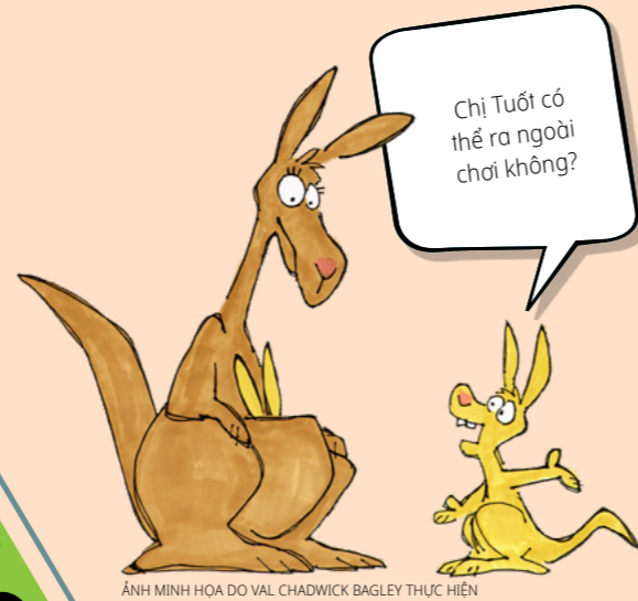
ẢNH MINH HOA DO VAL CHADWICK BAGLEY THỰC HIỆN

Hãy sắp xếp đàn chiên để tất cả chúng nằm gọn trong chuồng. Em có thể làm điều này bằng cách cắt các mảnh ghép ở trang 29 (sau khi em đã đọc bài viết ở trang tiếp theo) và sắp xếp chúng, hoặc thay vì thế, em có thể vẽ chúng vào.