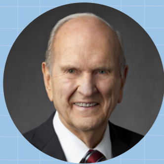
Prezidents Rasels M. Nelsons