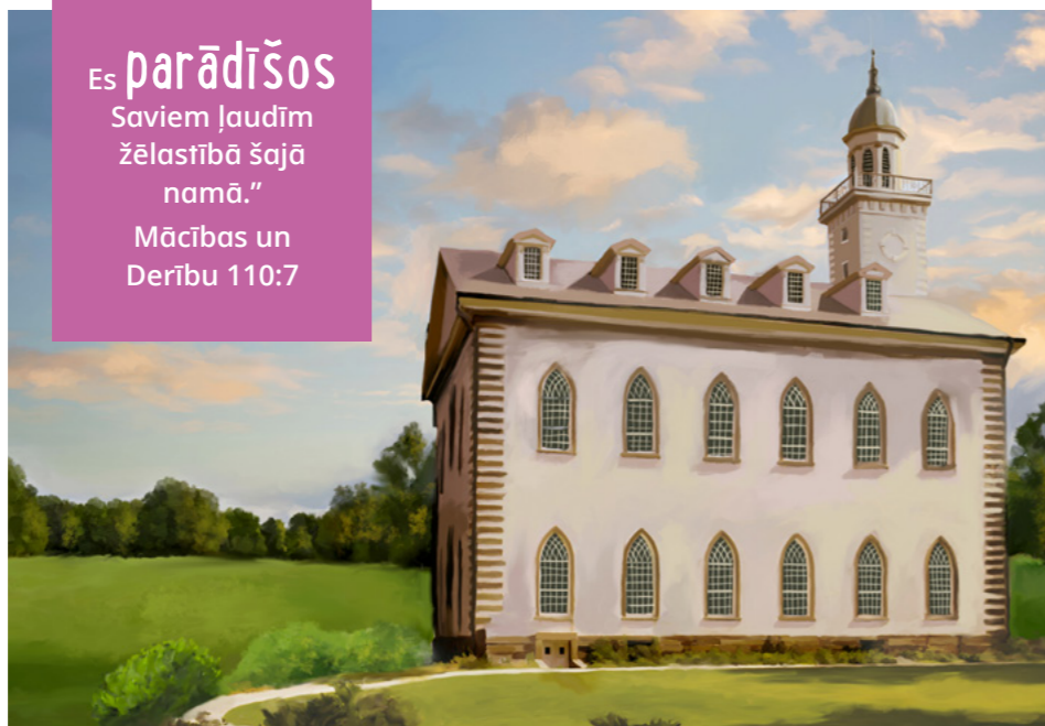
DEVIDA GRĪNA GLEZNA

Es parādīšos Saviem ļaudīm žēlastībā šajā namā.” Mācības un Derību 110:7