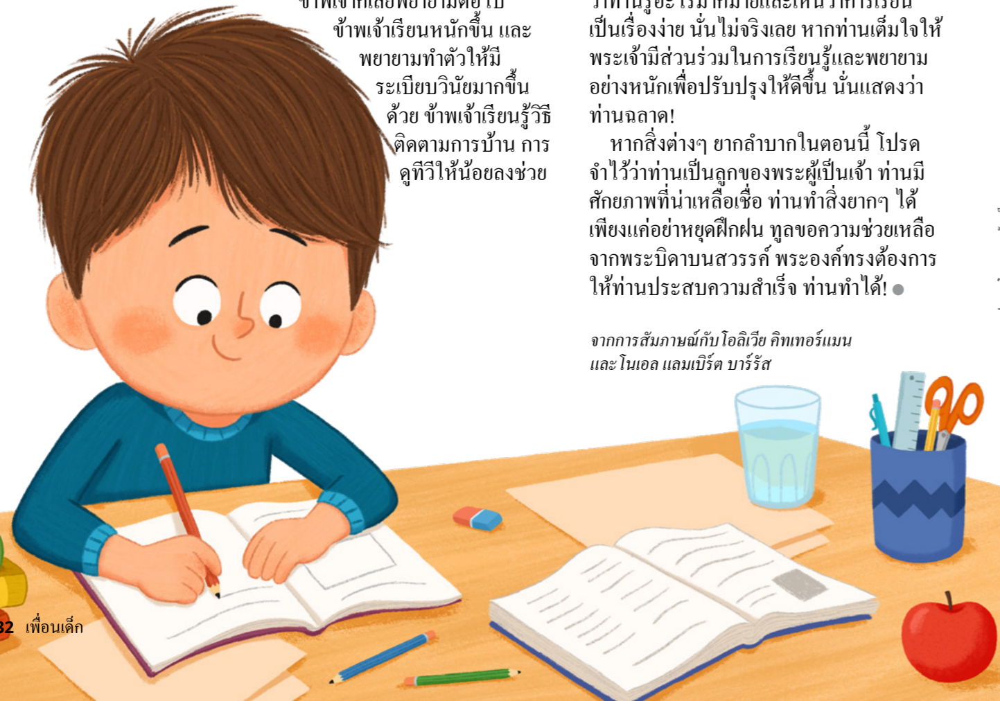
ภาพประกอบโดย แอนนา ซัทคานี

จากการสัมภาษณ์กับ โอลิเวีย คิทเทอร์แมน และ โนเอล แลมเบิร์ต บาร์ริส