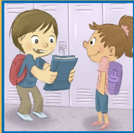
친구에게 물문경을 읽으라고 권해 보십시오.