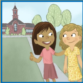
함께 교회 모임이나 활동에 가자고 친구에게 권해 보십시오.

여러분은 자라서 선교사로 봉사하겠다는 결심을 할 수도 있습니다. 그렇게 하면 여러분 자신과 다른 많은 사람들이 축복을 받을 것입니다. ●