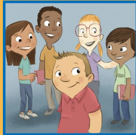
더 많은 친구들을 두루두루 사귀십시오.