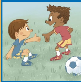
좋은 모범을 보이십시오.

여러분은 아래와 같은 방법으로 사람들이 복음이 주는 평안을 찾도록 도울 수 있습니다.