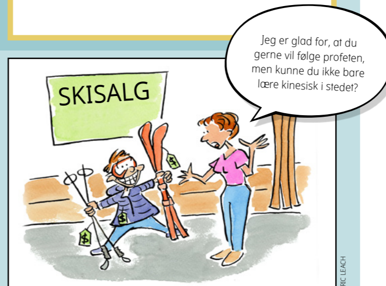
ILLUSTRATIONER: DAVID KLUG