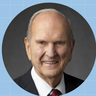
Præsident Russell M. Nelson