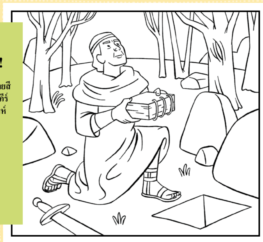
คำสอน: (ของ) โมโรไน; พระคัมภีร์มอรมอน; พระคัมภีร์มอรมอนเป็นความจริงที่ไม่