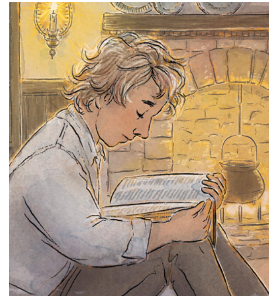
Bukwi iio tokālik, Josep Smith eaar riiti leta eo an Jemes ilo Baibōļ.