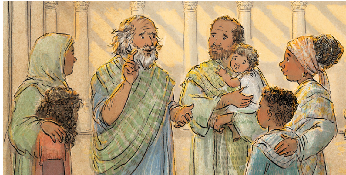
Jemes ekar juon Rijilōk. Eaar katakin ro jet kōn Jisōs Kraist. Eaar je juon leta nān armej ro raar tōmak ilo Jisōs.