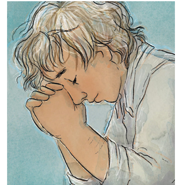
Eaar kajjitōk ippān Anij kabuñ ta eo en kobaļok ie.