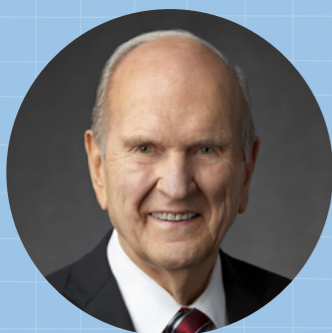
Prezidentas Raselas M. Nelsonas