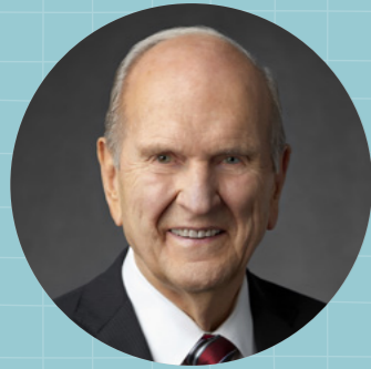
Par Russell M. Nelson