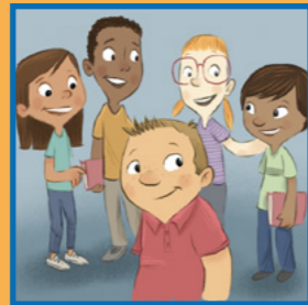
Duke zgjeruar rrethin e shokëve të tu.