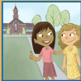
Duke ftuar një shok/shoqe të vijë në një mbledhje ose aktivitet të Kishës me ty.

Mund të vendosësh gjithashtu që të shërbesh në një mision kur të jesh më i/e madh/e në moshë. Kjo do të të bekojë ty dhe shumë të tjerë.