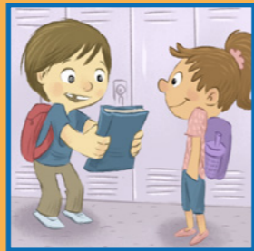
Duke ftuar një shok/shoqe të lexojë Librin e Mormonit.