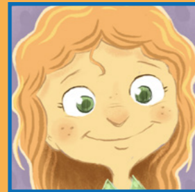
Duke ndjekur Jezu Krishtin që drita e Tij të mund të shkëlqejë në sytë e tu.