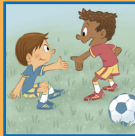
Duke qenë një shembull i mirë.

Ti mund t’i ndihmosh të tjerët ta gjejnë paqen e ungjillit: