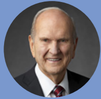
Nga Presidenti Rasëll M. Nelson