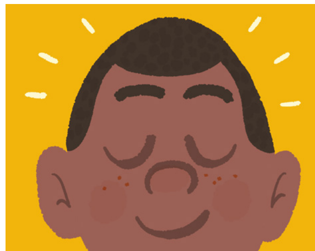
Jesus gav os nadveren, fordi han elsker os.