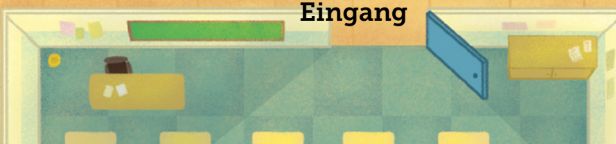
ILLUSTRATION VON CAROLINE CARROSSINE