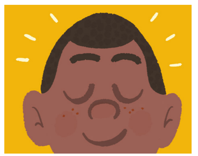
ព្រះយេស៊ូវប្រទានពិធីសាក្រាម៉ង់ដល់យើង ព្រោះទ្រង់ស្រឡាញ់យើង ។