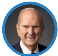
A. Præsident Russell M. Nelson

»Forældre, tak for alt, hvad I gør, for at opdrage jeres børn. Og børn, tak for alt, hvad I gør for at opdrage jeres forældre.«