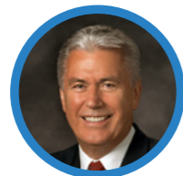
B. Ældste Dieter F. Uchtdorf