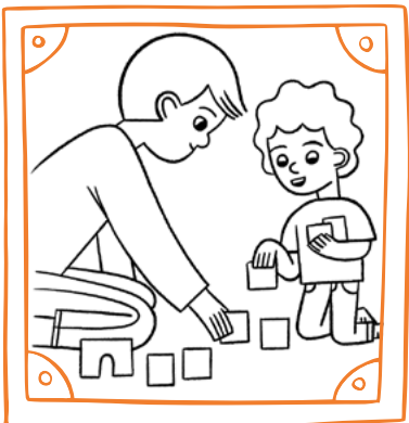
Erom juon waanjoŅak emŭan im jipaŅ ro jet.