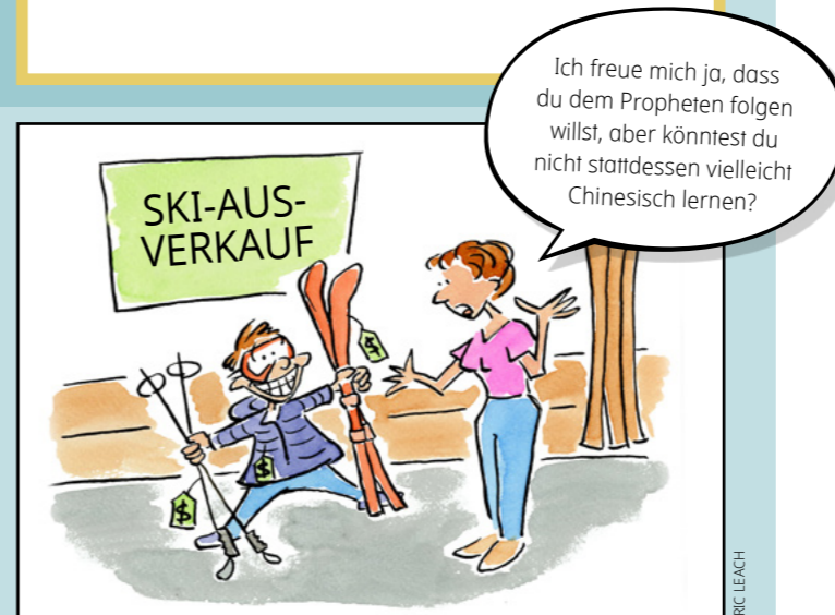
(Präsident Russell M. Nelson ist gern Ski gefahren, hat aber auch Chinesisch gelernt.)