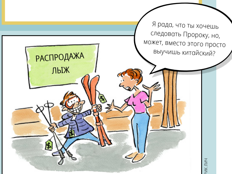
РИСУНОК ДЭВИДА КЛАГА