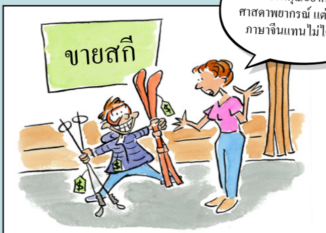
ภาพประกอบโดย เดวิด สลัก