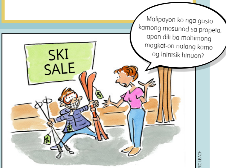
MGA PAGHULAGWAY PINAAGI NI DAVID KLUG