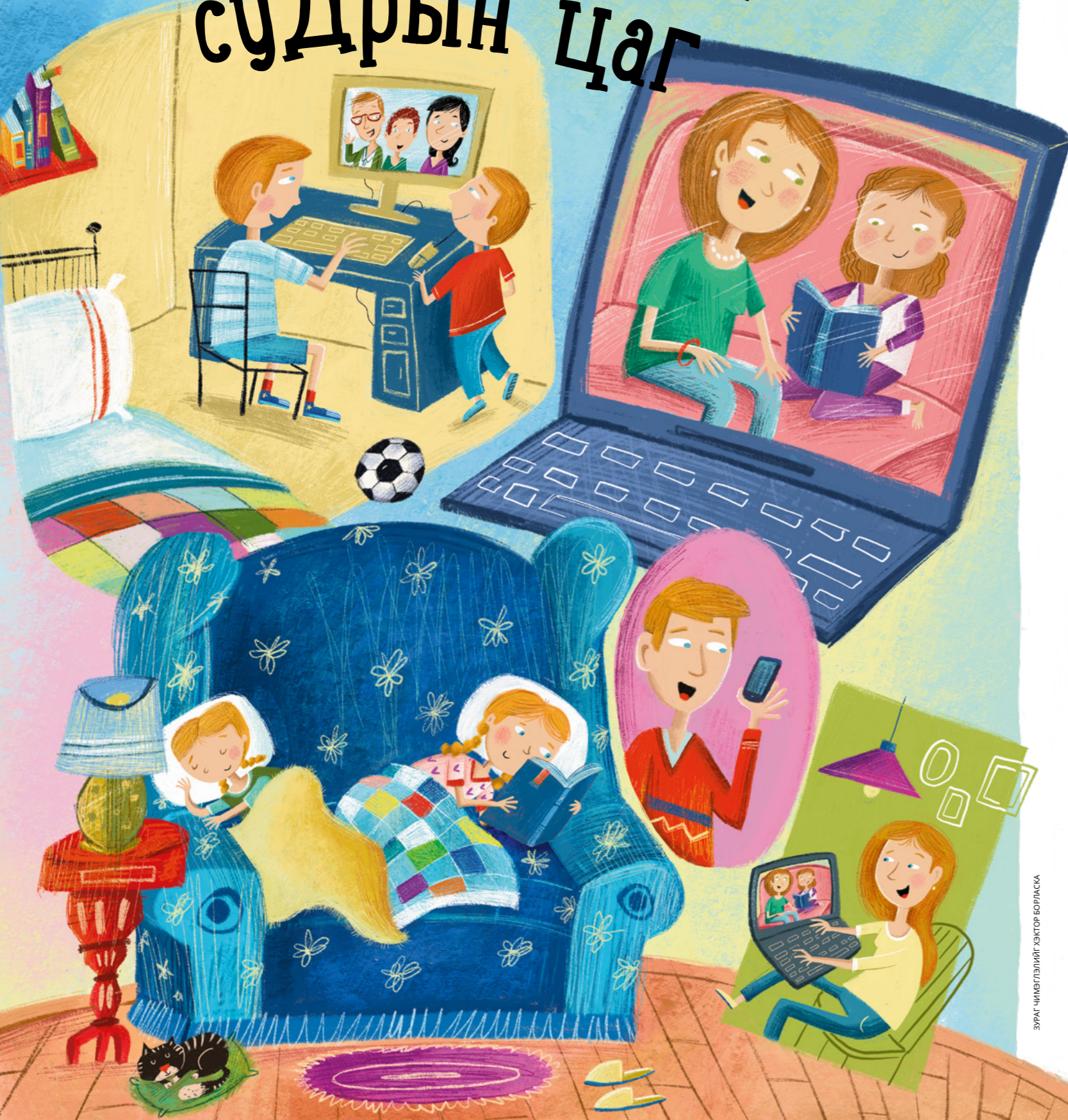
ЗУРАГ ЧИМЭГЛЭЛИЙГ ХЭКТОР БОРИЛАСКА

Люси Стивэнсон Ювэлл (Бодит түүхээс сэдэвлэв)