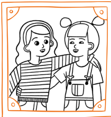
Tokoni'i e ní'íhi kehé ke nau ongo'i 'oku talitali lelei kinautolu.

'Oku ma'u 'e he Tamai Hēvaní ha ngaahi tāpuaki faka'ofa'ofa ma'amoutolu kotoa 'i homou hala ke foki ai kiate Iá!