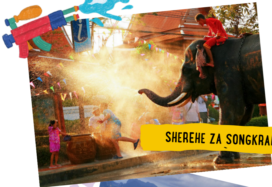
SHEREHE ZA SONGKRAN

Jifunze kuhusu watoto wa Baba wa Mbinguni ulimwenguni kote.