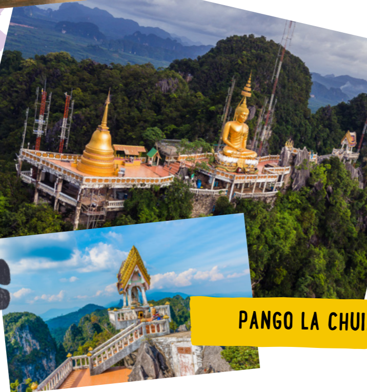
PANGO LA CHUIMILIA

Hekalu la Pango la Chui-milia ni hekalu la Kibudha ambapo watu wengi huabudu na kusali. Ili kulifikia, lazima upande ngazi 1,260 kuelekea juu mlimani. Kuna alama za nyayo za chuimilia ndani ya pango!