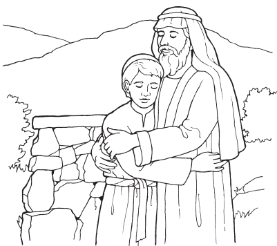
Авраам (Бытие 22:1–14)