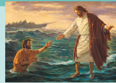
HISTOIRE DE JÉSUS : quand il a marché sur l'eau