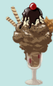
PLAT OU ALIMENT : les nouilles, les glaces avec nappage et garnitures