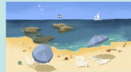
LIEU : la plage