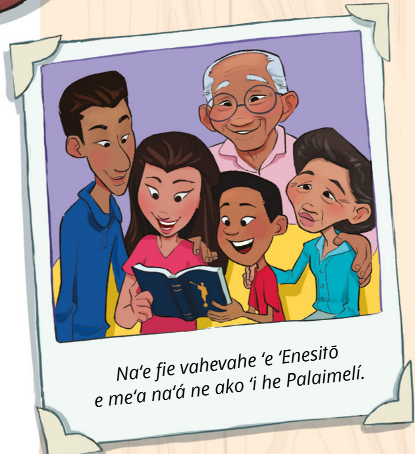
Na'e fie vahevahe 'e 'Enesitō e me'a na'á ne ako 'i he Palaimelí.

Na'e ongo'i loto-māfana mo loto-nonga 'a 'Enesitō. Na'á ne sai'ia ke vahevahe 'ene tui—ko ha me'a na'á ne 'ofa ai—mo Kulenimā mo Kulenipā—ko ha kakai na'á ne 'ofa ai. ●