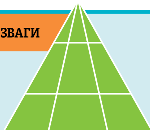
Відповідь на сторінці 31. Візуальна розгадка на fsoy.ChurchofJesusChrist.org .