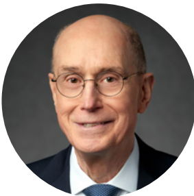
Από τον Πρόεδρο Χένρυ Μ. Άιρινγκ Δεύτερο Σύμβουλο στην Πρώτη Προεδρία