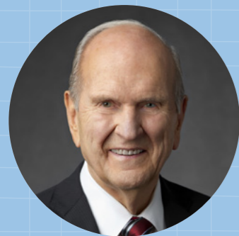
Ерөнхийлөгч Рассэлл М.Нэлсон