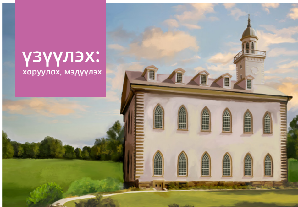
Зургийг дэвд грийн