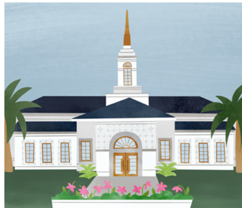
Đền Thờ Neiafu Tonga