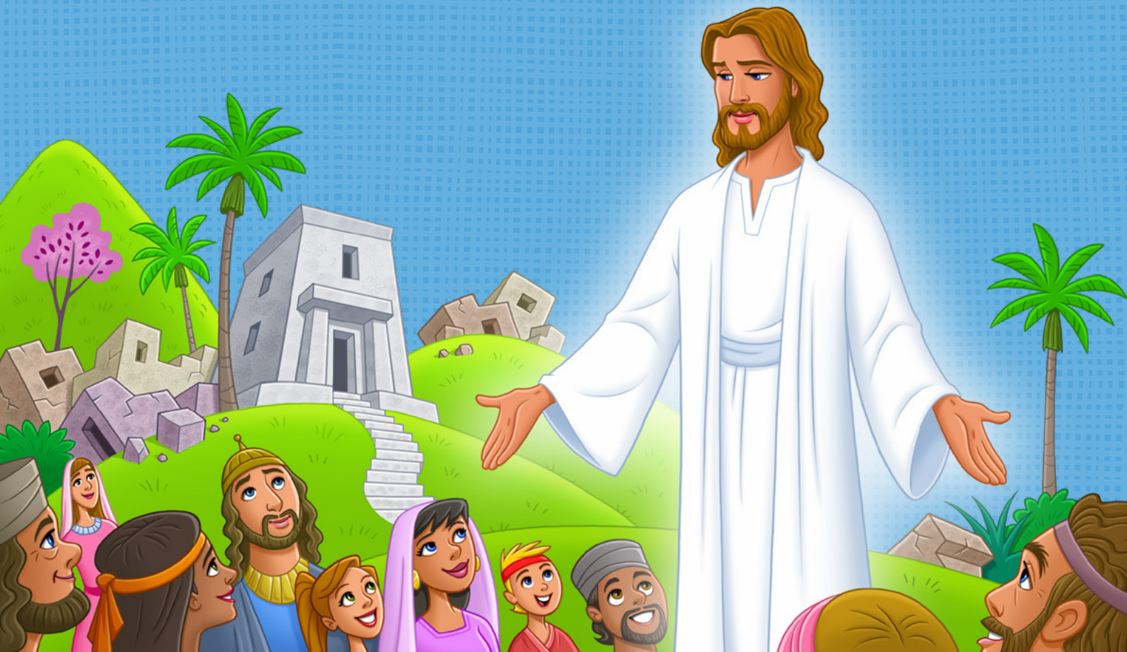
Svör: 1. Nefí; Saria og Lehi; Laman, Lemúel, Sam, Nefí