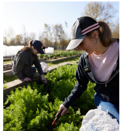
左下：「喂饱犹他 (Feed Utah)」食物捐赠活动在不到一天的时间内，就从该州各地收集了数千笔的食物捐献。