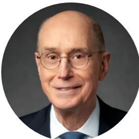
Henry B. Eyring forseti Annar ráðgjafi í Æðsta forsætisráðinu