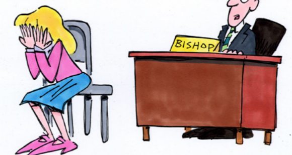
ILLUSTRATION: VAL CHADWICK BAGLEY

För sista gången – jag kan inte hjälpa dig att skicka in missionärsansökan. Du är bara 12 år!