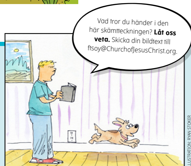
ILLUSTRATION: RYAN STOKER