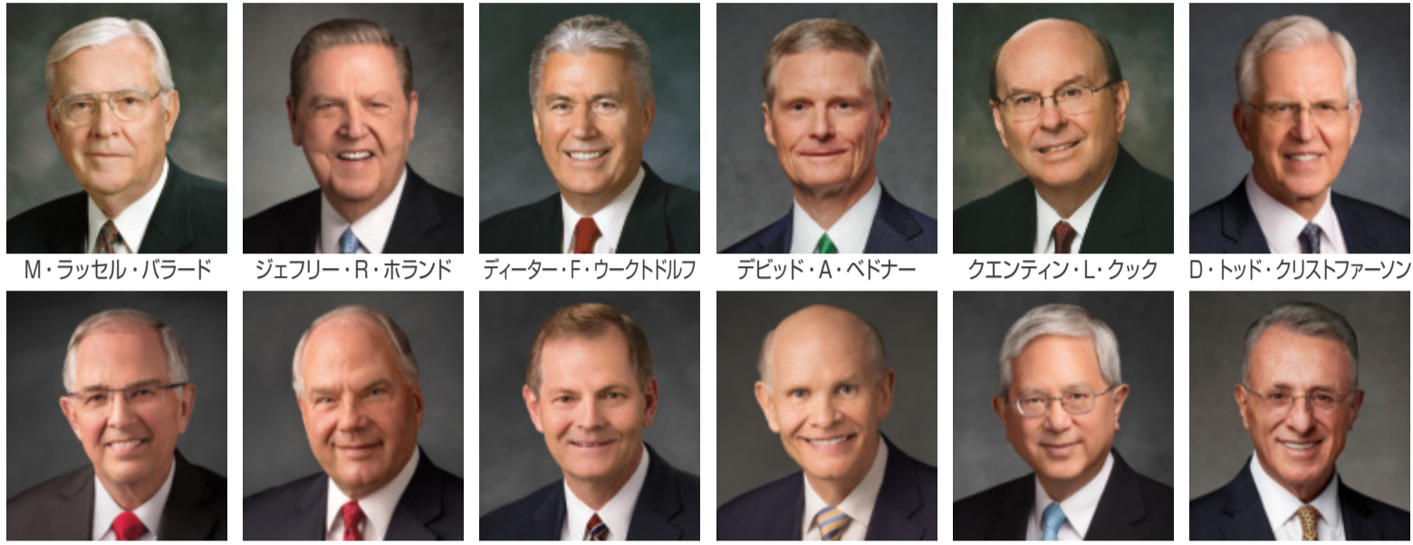
M・ラッセル・バラード ジェフリー・R・ホランド ディーター・F・ウークトドルフ デビッド・A・ベドナー クエンティン・L・クック D・トッド・クリストファーソン ニール・L・アンダーセン ロナルド・A・ラズバンド ゲーリー・E・スティーブソン デール・G・レンランド ゲレット・W・ゴング ウリセス・ソアレス