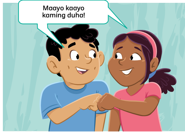
Tabla ra. Kamong duha maayo kaayong moserbisyo! Salamat sa inyong tabang.