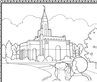
... wala nagapamensar sang malain.