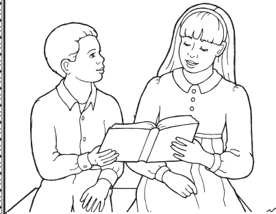
... nagakalipay sa kamatuoran.