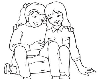
... wala nagakahisa.