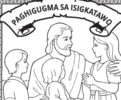
Ang putli nga gugma ni Cristo