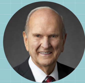
Iroun Beretitenti Russell M. Nelson

Anaaki man "Iangoa te Tiretio!" Riaona, Nobembwa 2023, 115-17.