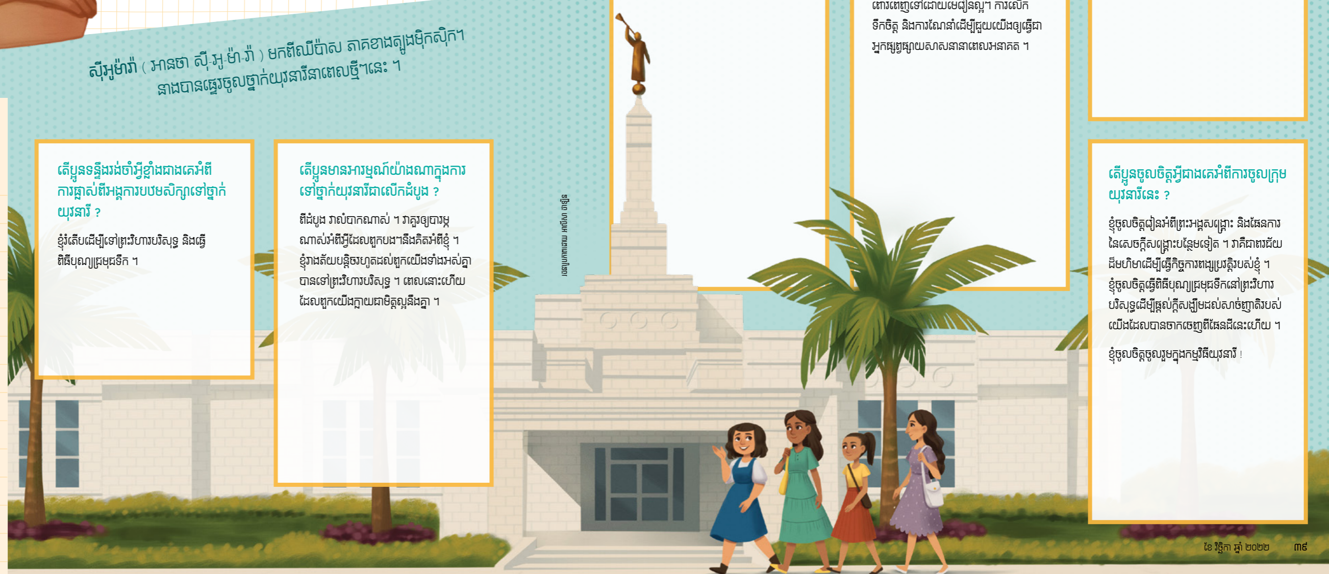
ធានាប្រាកដដោយ អាណិត ចន្ទីន

តើប្អូនចូលចិត្តអ្វីជាងគេអំពីការចូលក្រុមយុវនារីនេះ ? ខ្ញុំចូលចិត្តជុំវិញព្រះអង្គសព្វគ្រោះ និងផែនការនៃសេចក្តីសង្គ្រោះបន្ថែមទៀត ។ វាក៏ជាពរជ័យដ៏មហិមាដើម្បីធ្វើកិច្ចការពង្សប្រវត្តិរបស់ខ្ញុំ ។ ខ្ញុំចូលចិត្តធ្វើពិធីបុណ្យព្រមព្រៀងនៅព្រះវិហារបរិសុទ្ធដើម្បីផ្តល់ក្តីសង្ឃឹមដល់សាច់ញាតិរបស់យើងដែលបានចាកចេញពីផែនដីនេះហើយ ។ ខ្ញុំចូលចិត្តចូលរួមក្នុងកម្មវិធីយុវនារី !