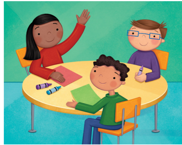
Maaari akong makinig at makipaghalinhinan. Gus-to ko ring igalang ang iba!