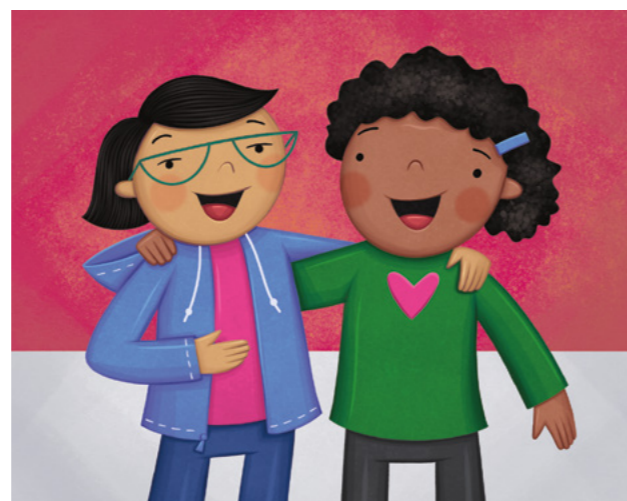
Matutularan ko si Jesus sa pamamagitan ng hindi pagbi-bigay ng bansag sa mga tao.