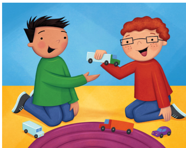
Maaari kong sabihing "pakiusap" at "salamat."