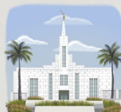
'Aita e maoro roa, e tai'ohia i te fenua Firipino e va'u hiero.

'Ua 'ite Felipe, tē pō atu ra. 'Ua fa'aea te mau manu i te vivivivi, 'e te mau pereta'i i te ta'ita'i pūai. 'Ua hau i te piti hora rāua tōna māmā i te haerera'a nā roto i te uru rā'au. Terā rā, te 'ē'a tāta'itahi tā rāua i rave, e au ra ia mai te pūrumu 'o tā rāua i rave nā mua atu. 'Ua mo'e roa rāua.