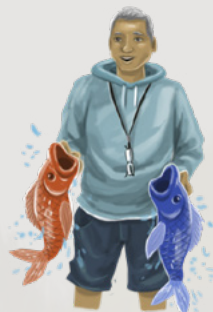
Mea au roa nā Felipe te i'a.