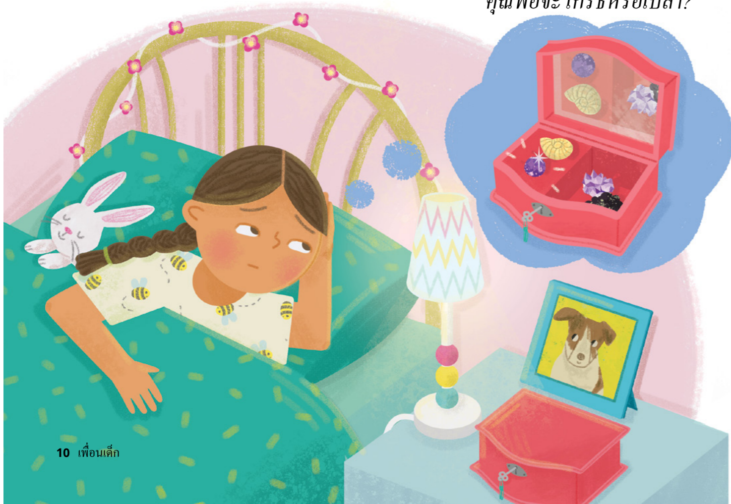
ภาพประกอบโดยเค็ ฐูช

ถ้าเธอบอกความจริง คุณพ่อจะโกรธหรือเปล่า?