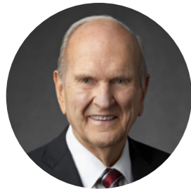
Presidentti Russell M. Nelson

Ilmoitus: viesti sinulle taivaalliselta Isältä