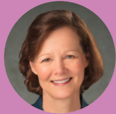
Susan H. Porter Präsidentin der Primarvereinigung der Kirche