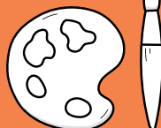
watercolor paint at paintbrush