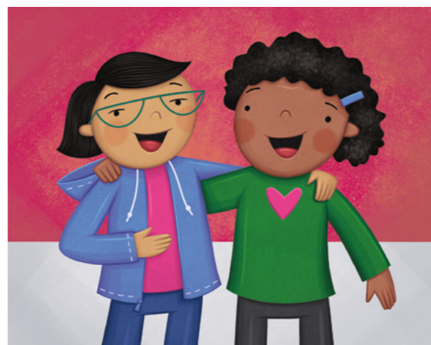
Te u lava 'o muimui kia Sīsū 'aki ha 'ikai ke u ui 'aki 'a e kakaí ha ngaahi hingoa ta'e'ofa.